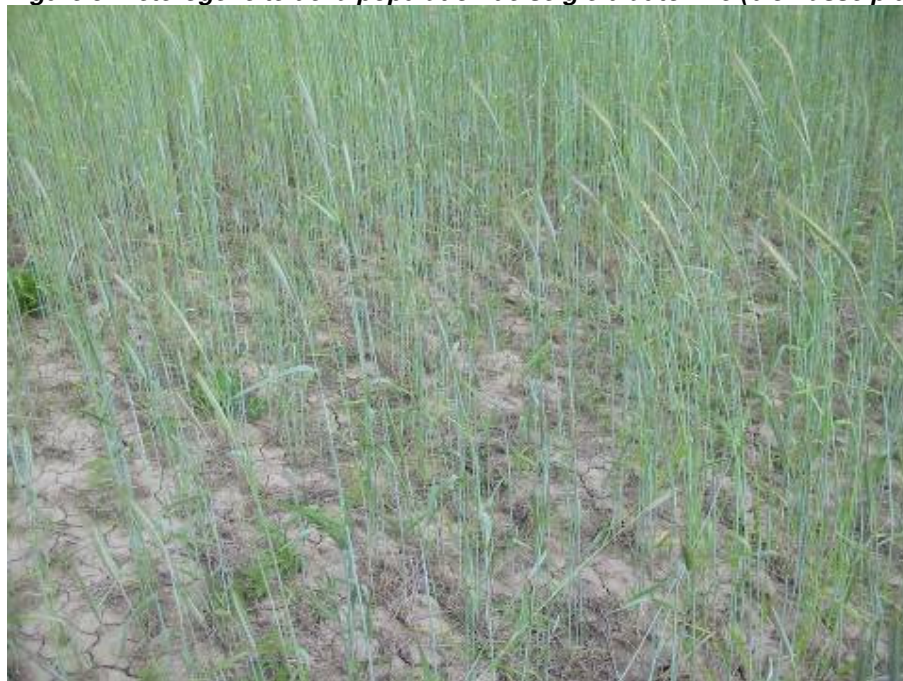
Figure 5. Hétérogénéité de la population de seigle d'automne (biomasse plutôt faible)

Comme nous l'avons mentionné dans les paragraphes précédents, le seigle d'automne a souffert de la pluie et de la glace durant l'hiver. Une population hétérogène a permis l'établissement des mauvaises herbes, herbe à poux, trèfle rouge, lampourde glouteron, graminées vivaces et autres espèces secondaires (Figures 5 à 7). Par conséquent, la biomasse du seigle a été très variable.