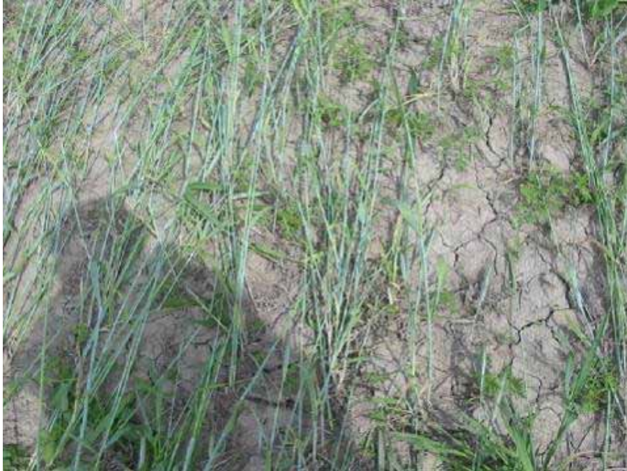
Figure 8. Paillis faible