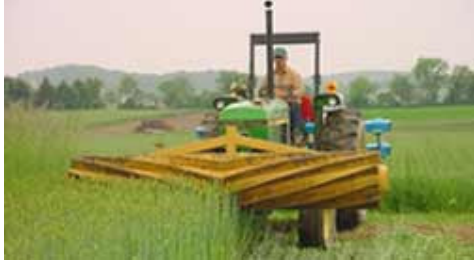
Figure 3. Modèle du rouleur de l'Institut Rodale

Cette différence porte sur les points suivants :