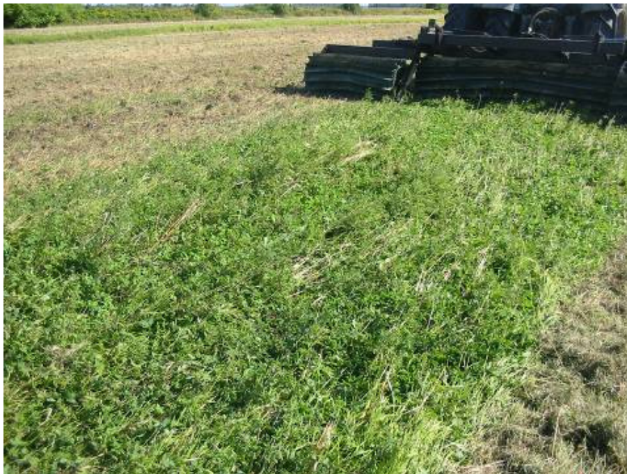
Figure 16. Roulage des bandes de trèfle rouge et mauvaises herbes suite à la récolte de blé

Les essais ont été réalisés dans un champ de blé qui avait du trèfle rouge comme plante compagne. Suite à la récolte du blé, le champ a été broyé sauf deux bandes de six mètres pour les essais de roulage.