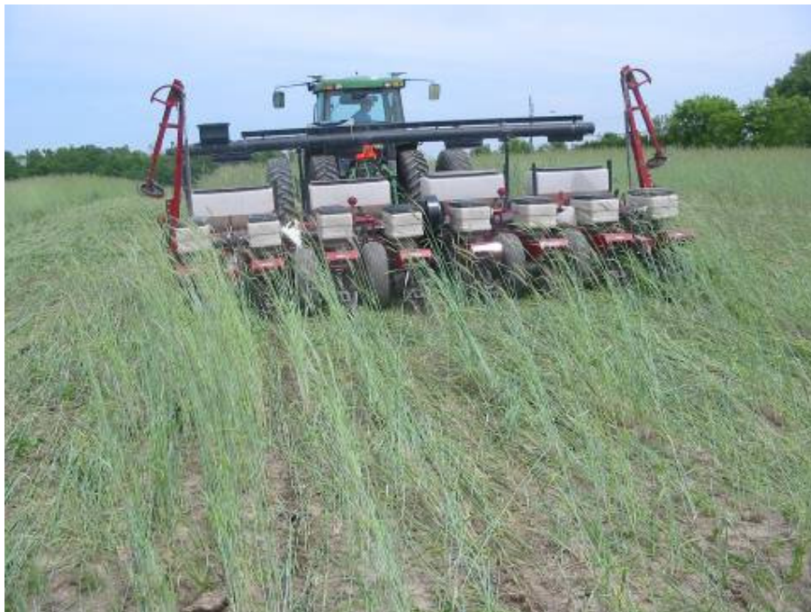
Figure 10. Semis direct du soya dans le seigle (traitement S+RT)

Les résultats sont compilés dans le tableau 9.