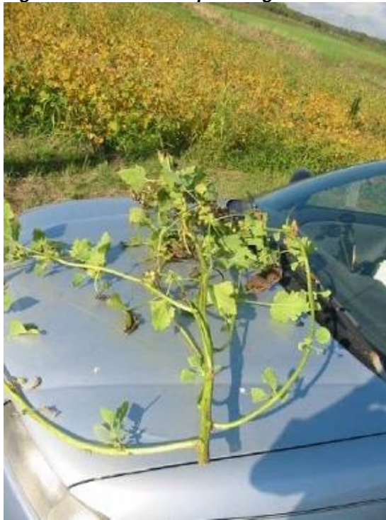
Figure 11. Plant de lampourde glouteron

Ces résultats nous font constater une tendance à une biomasse de mauvaises herbes plus faible en présence d'une plus grande biomasse de seigle dans l'entre-rang de soya pour deux traitements (RS et 2R). Cependant, la relation entre le rendement de soya et la biomasse des mauvaises herbes n'est pas linéaire et ce, quel que soit le mode de production (paillis versus sarclage). Cette relation est complexe et dépend de plusieurs facteurs. Par exemple, la biomasse d'une plante comme l'herbe à poux ou la lampourde glouteron, espèces dominantes dans le champ de seigle pouvait être très élevée comme les cas de l'échantillon 1 de STr et de l'échantillon 2 de S (tableau 10) (figure 11).