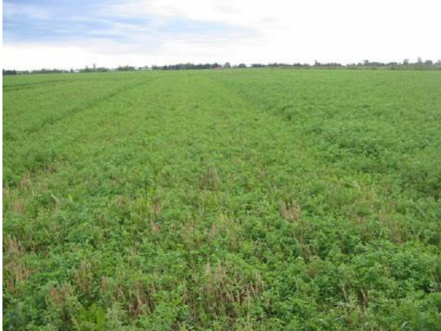
Figure 15. Roulage de la luzerne annuelle

L'essai avait donc comme objectif de vérifier si le roulage pouvait contrôler les mauvaises herbes et ainsi remplacer le broyage ce qui permettrait de réduire le temps de travail ainsi que la consommation de carburant (figure 15).