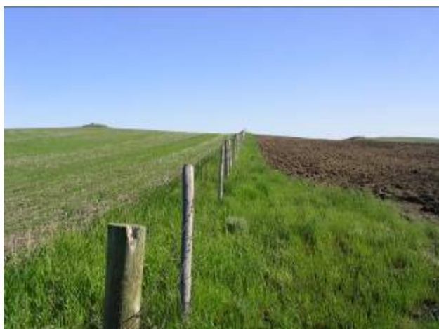
Une ferme conventionnelle (à g.) et sa voisine biologique (à dr.). Un travail du sol plus poussé dans les fermes biologiques peut entraîner une diminution du sol de surface et du carbone organique du sol.

En dépit de la mauvaise réputation des systèmes biologiques en matière de risques d'érosion du sol, il existe plusieurs méthodes culturales que les agriculteurs peuvent adopter pour atténuer les risques associés à des niveaux poussés de labour. Une étude menée à l'Université du Manitoba s'est intéressée aux deux approches — biologique et conventionnelle — afin de recenser les pratiques les plus efficaces pour diminuer les risques d'érosion.