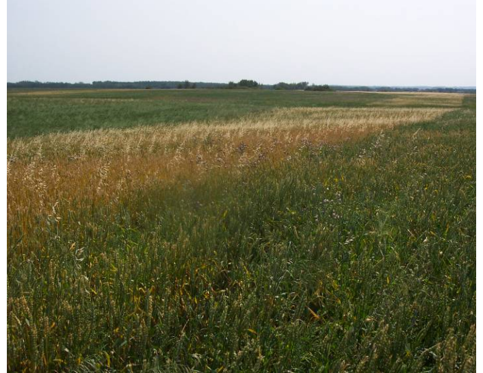
Champ travaillé et bande non travaillée dans laquelle les mauvaises herbes sont clairement visibles

Pris dans leur ensemble, ces résultats indiquent que le hersage contribue à réduire le nombre et la taille des mauvaises herbes, ce qui permet de réduire les effets compétitifs durant l'année de travail et le succès de reproduction ainsi que l'incidence sur les années à venir. Cependant, il est possible que le travail échoue et que le nombre et la taille des mauvaises herbes soient plus élevés dans les surfaces travaillées.