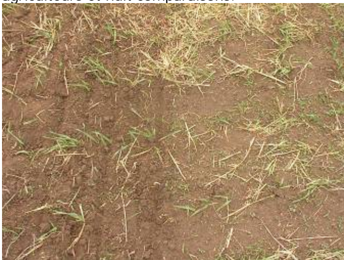
Travaillé (gauche) et non travaillé (droite) (Brenda Frick)

En 2003, six agriculteurs nous ont permis de surveiller leurs activités de travail, soit huit comparaisons par paires. En 2004, ce chiffre était réduit à trois agriculteurs et quatre comparaisons à cause d'un printemps et d'un été très pluvieux. En 2005, nous avons surveillé huit agriculteurs et effectué quatorze comparaisons et, en 2006, trois agriculteurs et huit comparaisons.