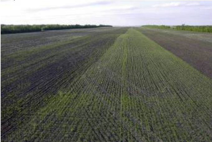
Culture de blé Red Fife travaillée 0, 1 ou 2 fois (Marc Loiselle)

Le hersage ne touche pas autant les cultures que les mauvaises herbes. Bien que le nombre de cultures ait été réduit à 73 % et à 67 % par un passage unique ou deux passages, respectivement, la biomasse des cultures affiche une réduction plus faible, soit 91 % et 86 %, respectivement.