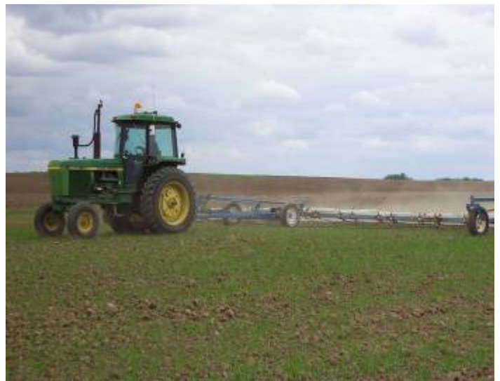
Hersage à la ferme